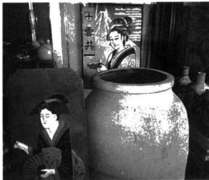
大高茶舗の雲井の肖像と刻印のある壺

お店は、忠敬橋のすぐそばにある。約二五〇年前前水戸藩士であった初代が煙草製造と製茶業の店を佐原に開いた。