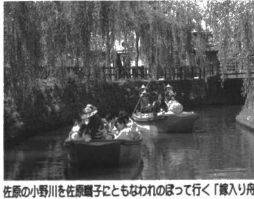
佐原の小野川を佐原囃子ともなわれのぼって行く「線入り舟」