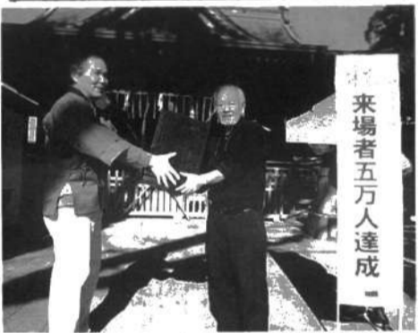
高橋理事長より五万人目の入場者に記念品の贈呈

私達NPOと香取市との共催で平成十八(二〇〇六)年六月に始まった「骨董市」も今年の一、四日(三、四)目を迎え、五万人の入場者数を記録することとなりました。幸運の入場者には記念品が渡され、記録達成を祝いました。