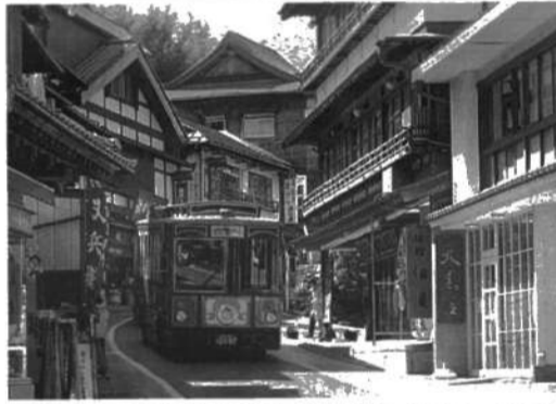
成田の新勝寺門前をめぐるレトロ・バス