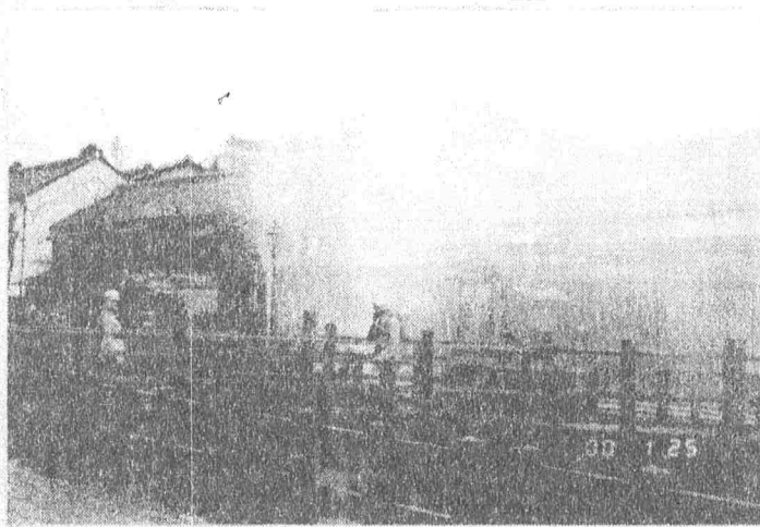
「放水」の合図で勢いよく噴き上がる水