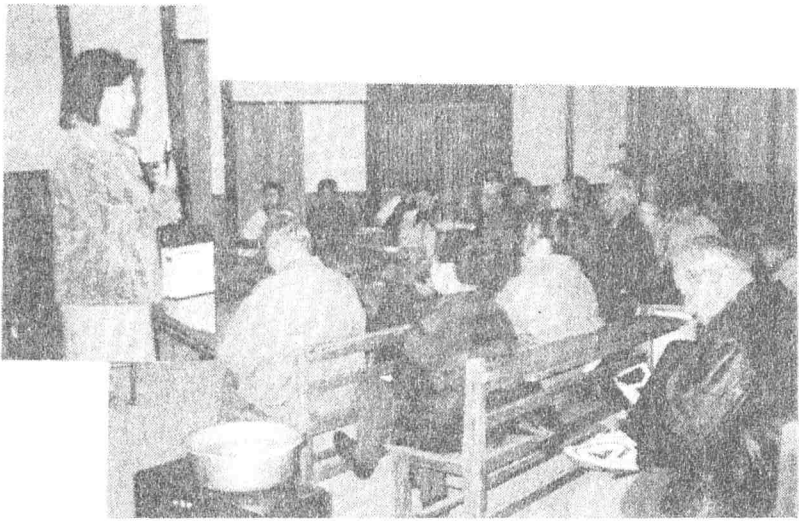
講師の話に熱心に耳を傾ける参加者

分がたくさんありました。お迎えする態度、説明の姿勢、指示する手、視線のあり方、マイクの持ち方と効果的な使用方法など、具体的な動作によって魅力的かつ印象的なものになることを理解しました。一番大切なことは、「何を伝えたいのか。」説明の要点をしっかり把握していること。次に観光客のニーズに答えられる柔軟性を持つこと。(例えば、観光客の年齢層、案内時間など。)すぐに役立つ講演でした。さすがはガイドの指導員とあって、人をそらさず引き付ける話術に、二時間があっという間に過ぎてしまいました。