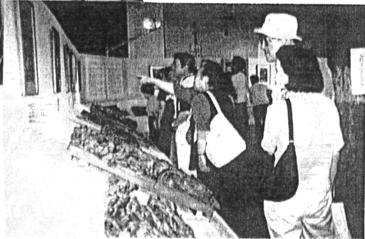
「あの絵がこの彫り物に・・・」感嘆の声

サテライト会場となった正上穀倉、福新呉服店、三菱館、馬場酒造、清宮邸土蔵と、それぞれの場所で佐原の時代の流れを表わす催し物があり、昔懐かしいノスタルジアと共に先人の生活の知恵に感動する姿が見られた。