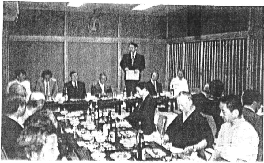
活動に向けて来賓の方々から力強い激励をいただく

・地区内への緊急車両進入障害の対策 ・会員の増強、保存会との共同会議 この他にも、●町並み案内研修と受入れ対策●誘導サインの検討●小野川清掃、ゴミステーションの美観対策●瓦版の発行、機関誌やパンフの立案●町並み案内地図の統一への働きかけ●三菱館の管理運営の充実などに取り組む。